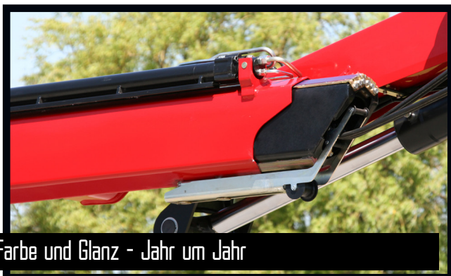
Farbe und Glanz - Jahr um Jahr

Das patentangemeldete EVS-Standsicherheitsystem von HMF berücksichtigt kontinuierlich die aktuelle Last des Fahrzeugs, damit Kran und Lkw in perfekter Balance sind. Das System berechnet die Last auf der Pritsche als ein Teil des Eigengewichts des Fahrzeugs. Das bedeutet, dass Sie mit Last auf der Pritsche einen erheblich größeren Arbeitsbereich erreichen - dies erlaubt das EVS-System!