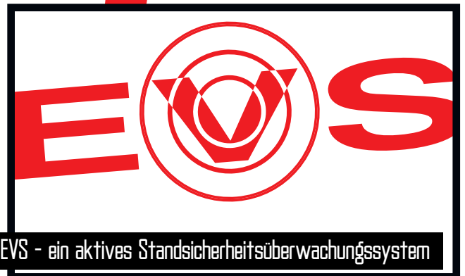
EVS - ein aktives Standsicherheitsüberwachungssystem

Die Funkfernsteuerung von HMF bietet alle Vorteile und Möglichkeiten für Funkfernbedienung wesentlicher Kran- und Sicherheitsfunktionen. Der Kranbediener kann sich im ganzen Arbeitsbereich frei bewegen und sich jederzeit optimal im Verhältnis zur Hebeaufgabe platzieren. Die Krane sind mit dem HDL-System ausgerüstet, welches automatisch die Krangeschwindigkeit an die Arbeitssituation anpasst.