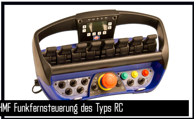
HMF Funkfernsteuerung des Typs RC

Die Funkfernsteuerung von HMF bietet alle Vorteile und Möglichkeiten für Funkfernbedienung wesentlicher Kran- und Sicherheitsfunktionen. Der Kranbediener kann sich im ganzen Arbeitsbereich frei bewegen und sich jederzeit optimal im Verhältnis zur Hebeaufgabe platzieren. Die Krane sind mit dem HDL-System ausgerüstet, welches automatisch die Krangeschwindigkeit an die Arbeitssituation anpasst.