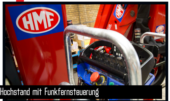
Hochstand mit Funkfernsteuerung

HMF macht keine Kompromisse bei der Oberflächenbehandlung! Dies schaffen wir bei HMF mit der ZetaCoat-Vorbehandlung und der EQC-Oberflächenbehandlung, denn dann entstehen keine Rostbildungen. Wir garantieren die denkbar beste Oberflächenqualität, die nicht verbleicht oder Rostschäden bekommt.